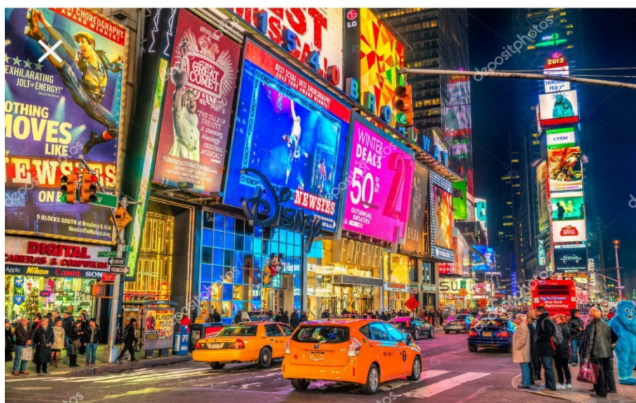
Fig. 2 New York. Times Square