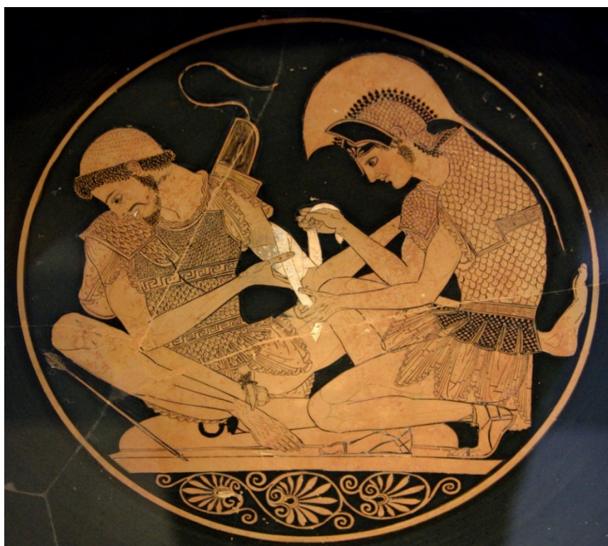
Fig.1 Achille benda Patroclo , vaso con figure rosse del pittore di Sosia, circa 500 a.c. Ubicazione: Altes Museum , Berlino