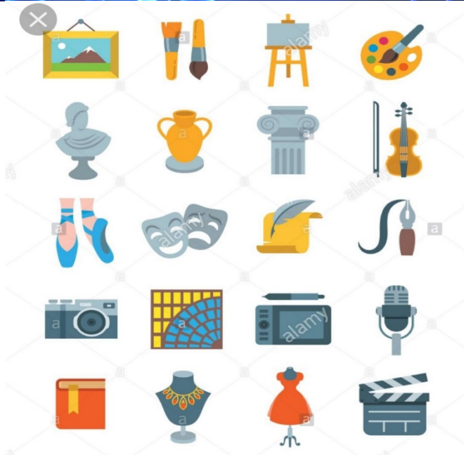
Fig. 5 Elementi caratterizzanti vari ambiti artistici